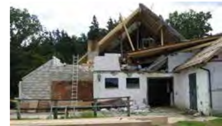
Bild unten: Während des Umbaus wurde das offene Gebäude schwer von einem Sturm beschädigt.